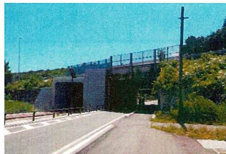
南湖トンネル南口