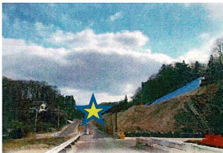
南湖トンネル北口