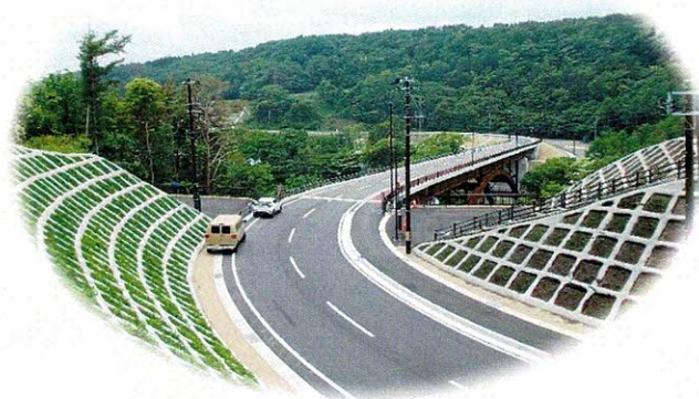
由井ヶ原側（北側）から国道289号方面向けの全景