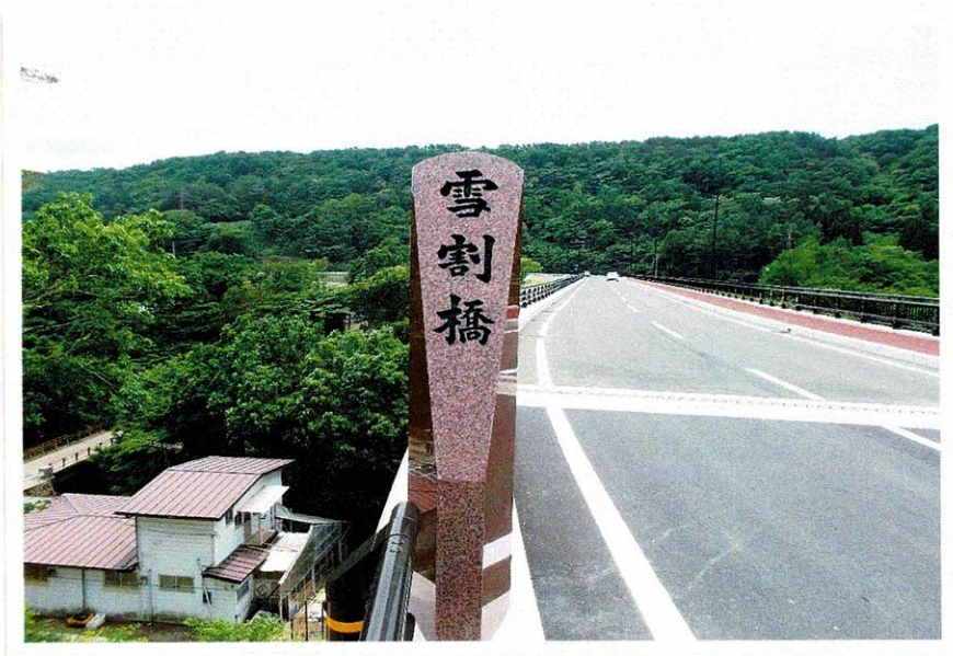
由井ヶ原側（北側）から国道289号方面と“橋梁名柱” （左下に4代目雪割橋が僅かに見える。）